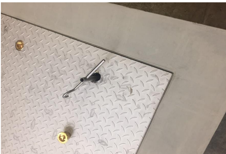
Figuur 2 Stap2: De bijbehorende sleutel op de knevel plaatsen en tegen de klok in draaien om de knevel te ontgrendelen