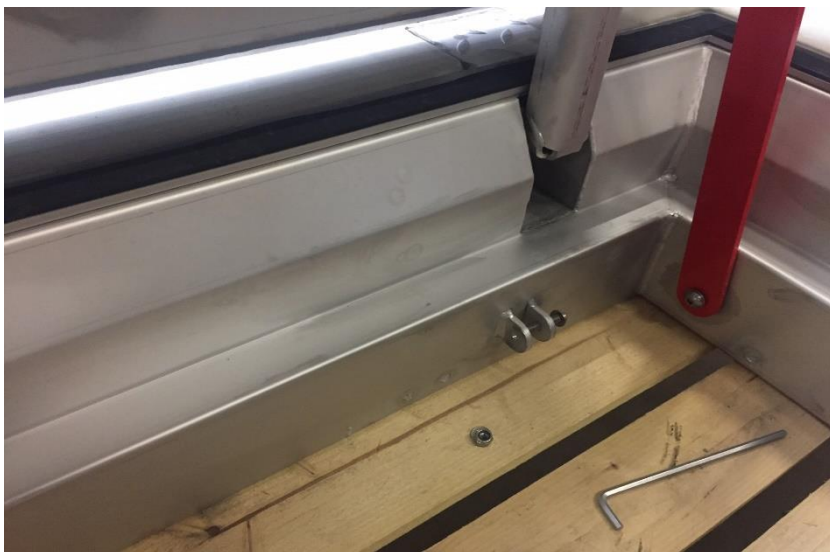
Figuur 4 Montagevoorziening gasdrukveer 1

3. Monteer de gasdrukveren in de daarvoor bedoelde voorzieningen. (zie figuur 4 en 5)