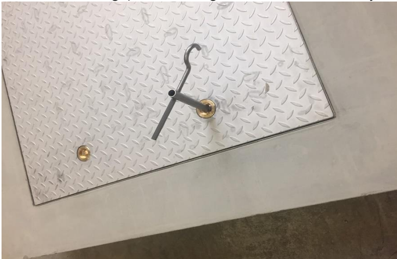
Figuur 1 Stap 1: Met bijbehorende sleutel de messing afsluitdoppen eruit draaien