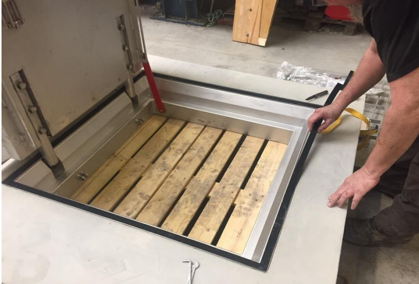
Figuur 3 Aanbrengen neopreen