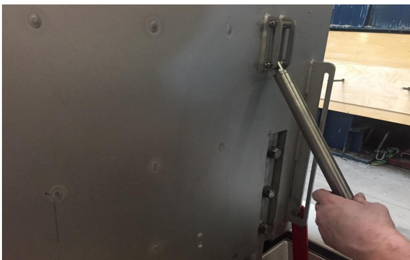
Figuur 5 Montagevoorziening gasdrukveer 2